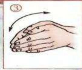
«Ныряющие» движения руками – «рыбка плывёт».