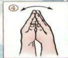
Качаем сомкнутыми ладонями влево-вправо.

Пять маленьких рыбок играли в реке. ① Лежало большое бревно на песке. ② И рыбка сказала: «Нырять здесь легко!» ③ Вторая сказала: «Ведь здесь глубоко». ④ А третья сказала: «Мне хочется спать!» ⑤ Четвёртая стала чуть-чуть замерзнуть. ⑥ А пятая крикнула: «Здесь крокодил! ⑦ Плывите скорей, чтобы не проглотил!» ⑧