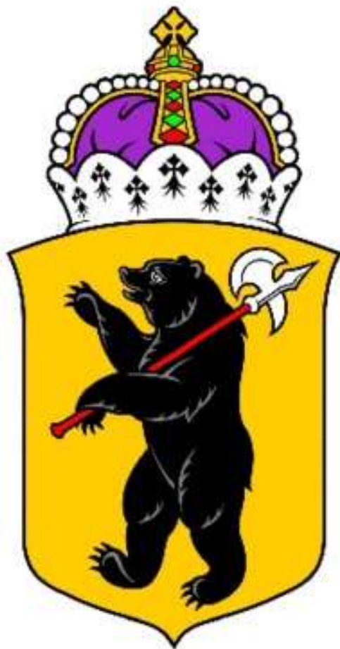
ГЕРБ ГОРОДА ЯРОСЛАВЛЯ