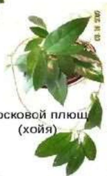
восковой плюш (хойя)