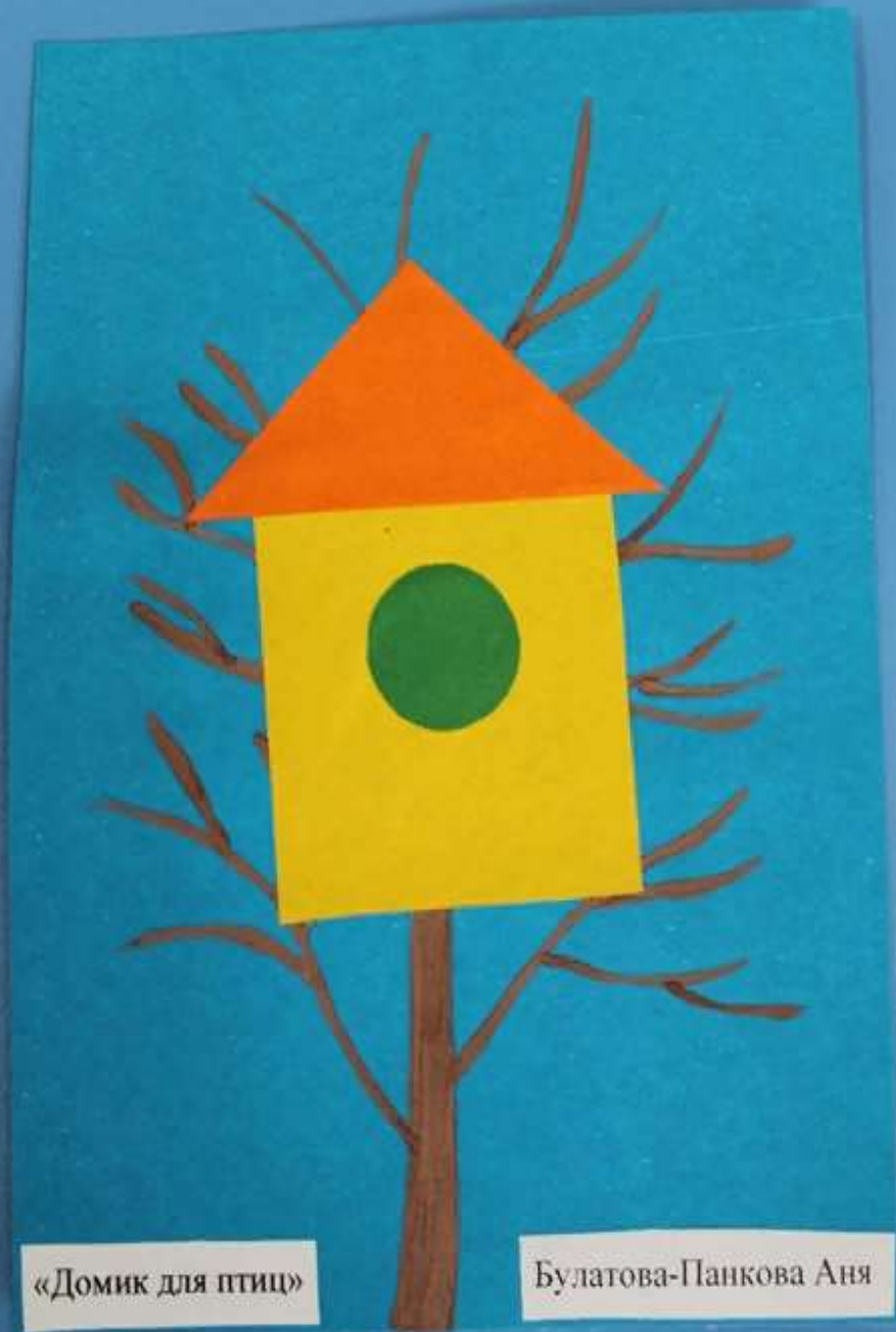
«Домик для птиц»