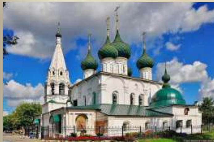
Церковь Ильи Пророка.