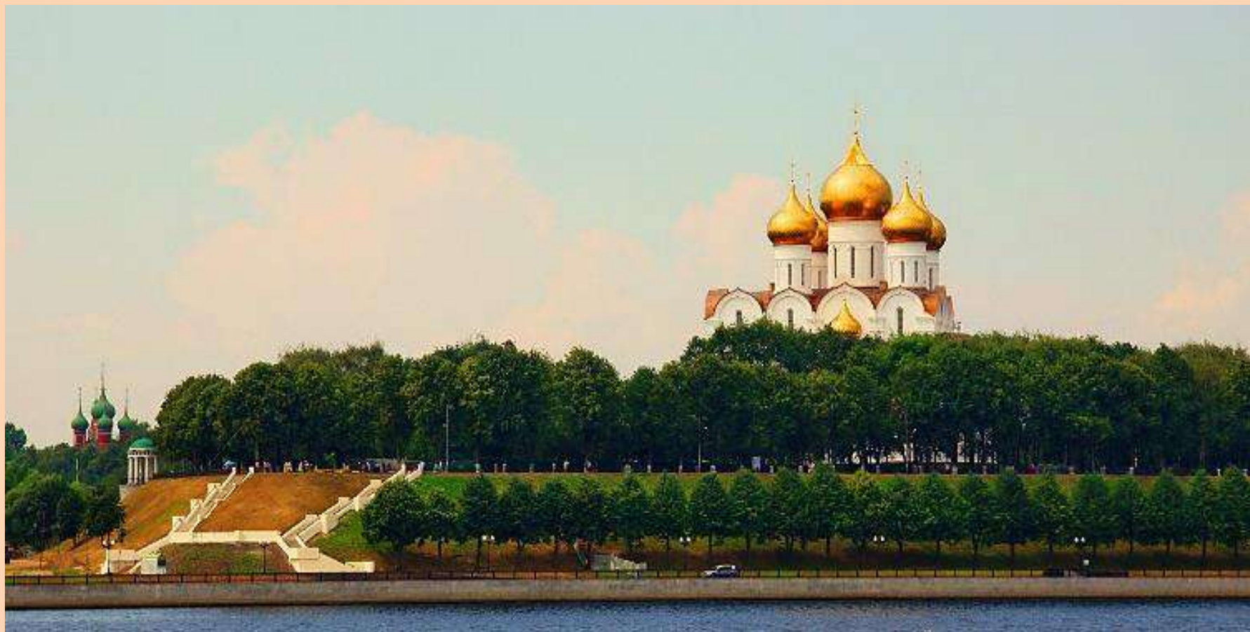
Вид на верхний ярус Стрелки. (Стрелка вечером)