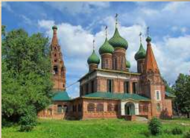
Церковь Николая Мокрого.