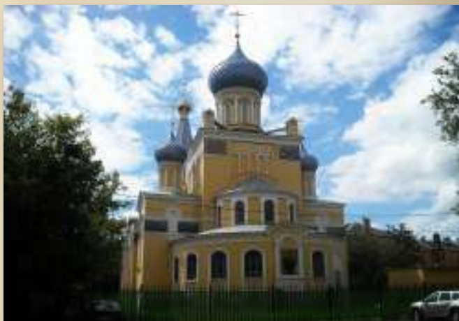
Церковь Андрея Критского.