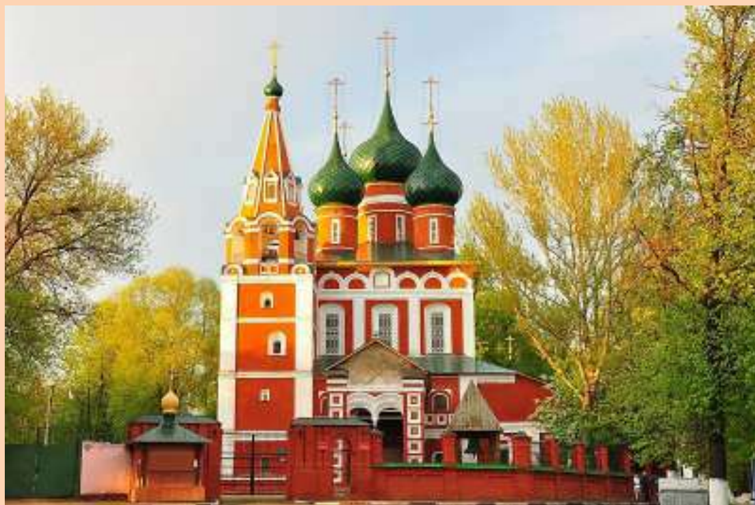
Церковь Михаила Архангела.