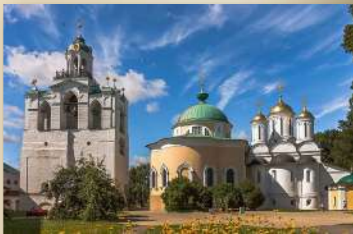
Спасо – Преображенский собор.