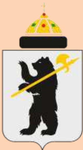
Герб города Ярославля.

Медведя князь секирой зарубил, И так народ он покорил. И чтобы помнили о том, Медведь с секирой стал гербом.