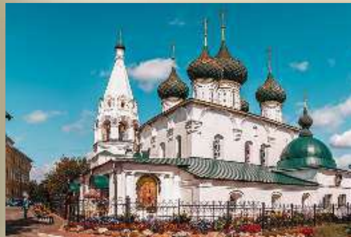
Церковь Спаса на Городу.