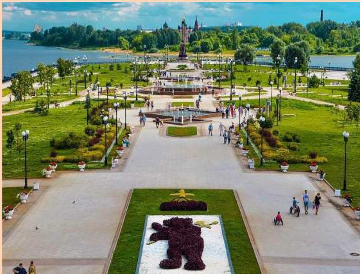
Нижний ярус Стрелки.