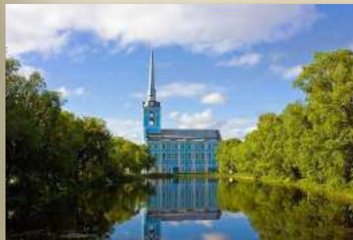
Церковь Петра и Павла.