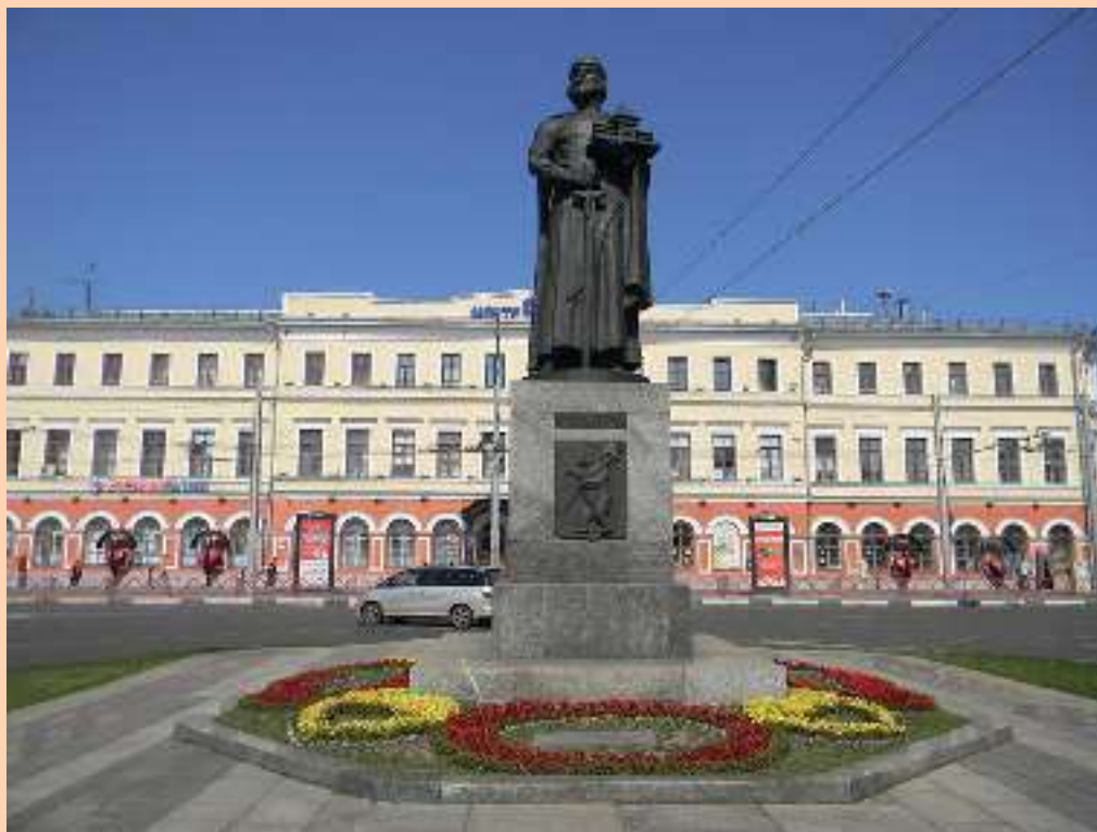
Памятник Ярославу Мудрому в центре города.

Вот князю памятник стоит, На крепость зорко он глядит, Любуется своим творением. Ведь город стал на загляденье!