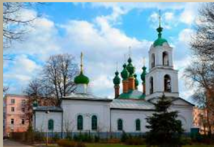
Церковь Вознесения Господня.