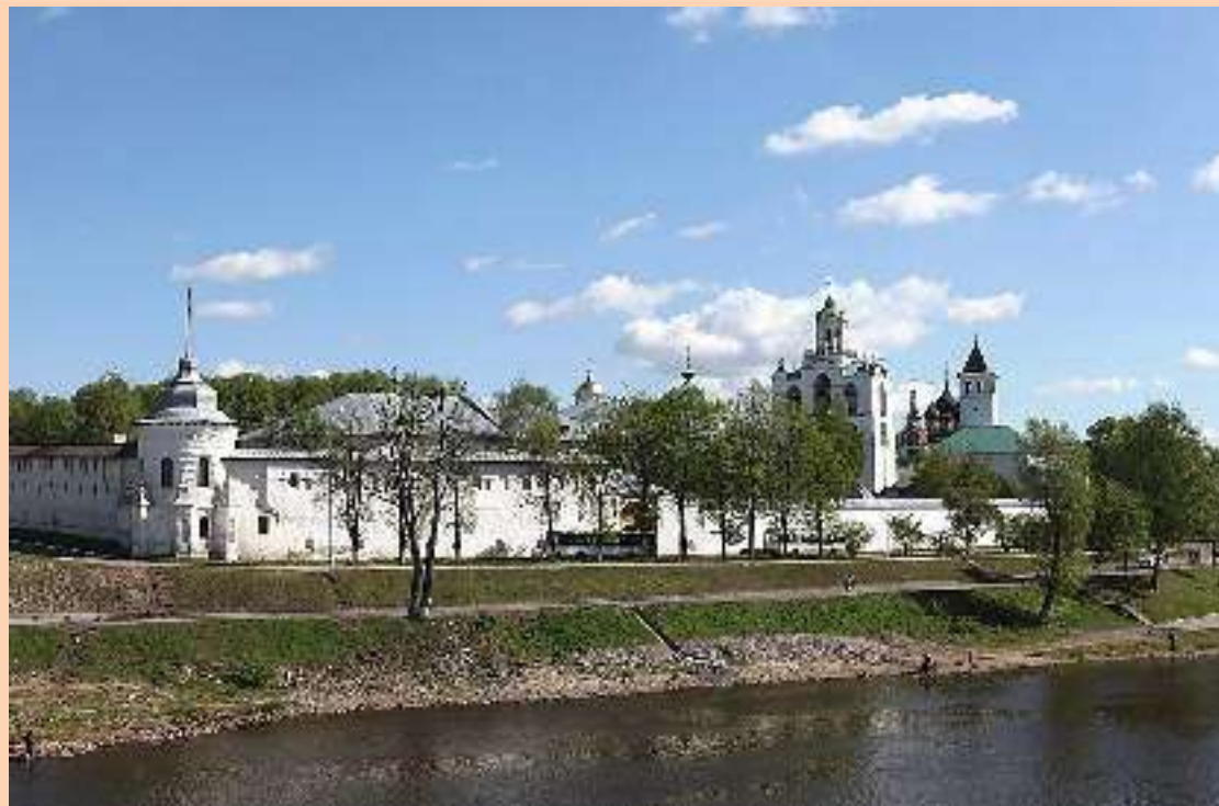
Спасо-Преображенский монастырь. Ярославский музей-заповедник.